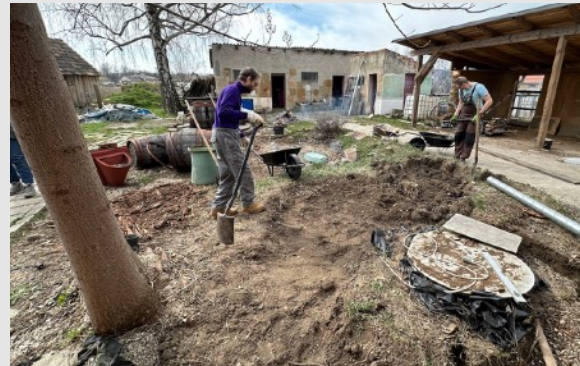
Hrubá úprava terénu, vykopanie preliačieniny.