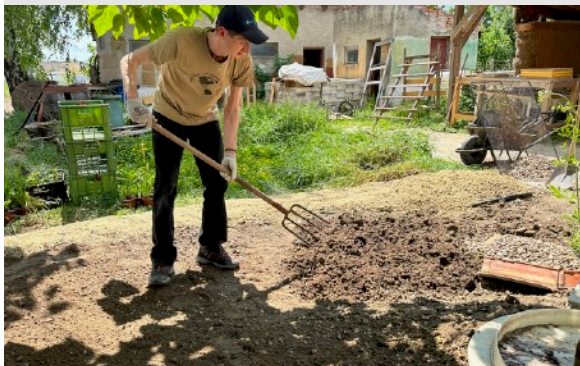
Prekyprenie dna dažďovej záhrady pre lepšie vsakovanie.