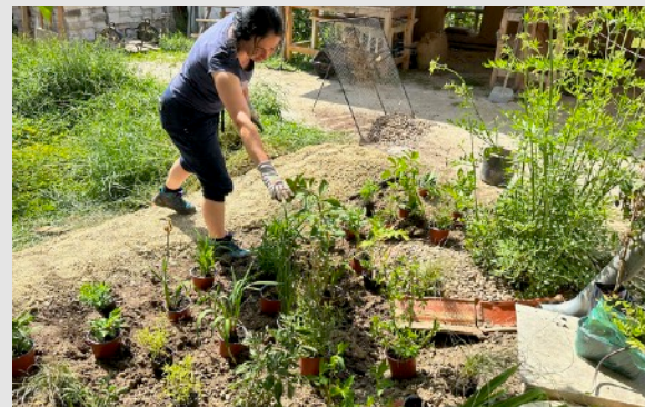
Návrh a rozloženie rastlín trvalkového záhona, zohľadňujúci mokrú, suchšiu, slnečnú a tienenu časť.