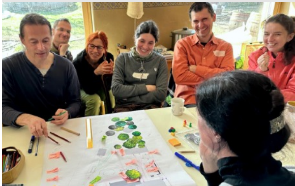
Návrh, vznikajúci po spoznaní situácie na mieste a schopnosti vsakovania zeminy. Približný prepočet plôch.

Na pozemku sme riešili dažďovú vodu zbieranú z viacerých striech. Tu je postup dažďovej záhrady, jedného z opatrení, resp. z viacerých riešení.