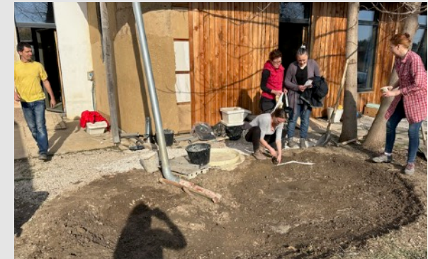
Osadenie prívod dažďovej vody. Presnejšie dotvarovanie dažďovej záhrady.