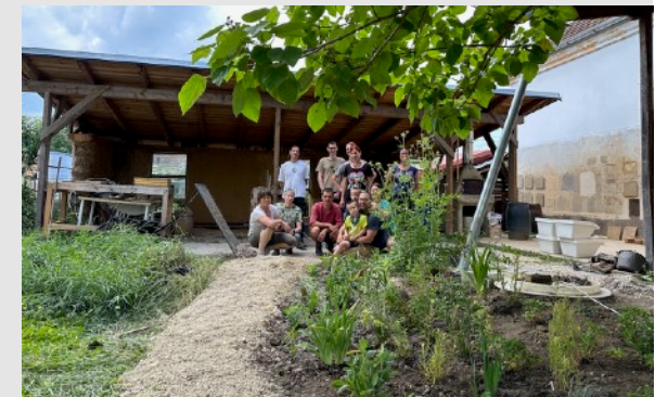
Vysadenie trvalkového záhona v dažďovej záhrade a zalievanie v prvých dňoch.

Video: Dažďová záhrada (3 minúty): https://youtu.be/FcoFQNRgQ5U