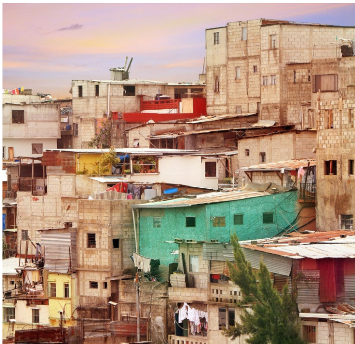
Obrázok 2 - Tretina mestských obyvateľov - 1,6 miliardy ľudí - by mohla do roku 2025 bojovať o zabezpečenie dôstojného bývania