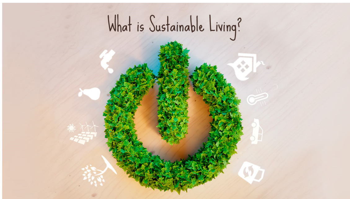
Obrázok 1

“Trvalo udržateľný životný štýl sú spôsoby konania a spotreby, ktoré používajú ľudia na to, aby sa spojili a odlíšili od ostatných, ktoré spĺňajú základné potreby, poskytujú lepšiu kvalitu života, minimalizujú využívanie prírodných zdrojov a emisie odpadu a znečisťujúcich látok počas životného cyklu, a neohrozujú potreby budúcich generácií.” (Prekonanie výziev vo výskume, podpore a realizácii trvalo udržateľného životného štýlu. Westminster, Centrum trvalo udržateľného rozvoja, Univerzita Westminster; strana 48 / Overcoming the challenges to researching, promoting, and implementing sustainable lifestyles. Westminster, Centre for Sustainable Development, University of Westminster; strana 48.)